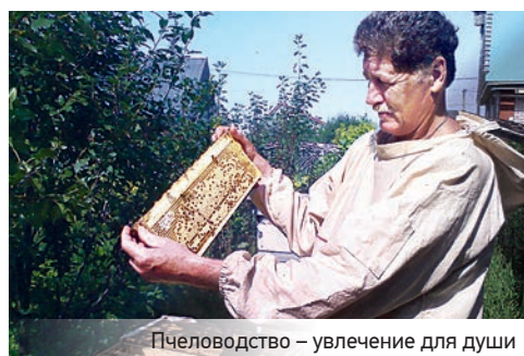
Пчеловодство – увлечение для души

— Основное направление деятельности в качестве начальника ПТО состояло в том, чтобы обеспечить производственные партии современной техникой, скважинными приборами и оборудованием. Работать с заказчиками по обеспечению безопасных условий труда на скважинах, согласно требованиям Правил. Создавать условия для нормального функционирования производственных партий, в том числе решать и кадровые вопросы. В сложные 90-е годы многого не хватало: и техники, и скважинных приборов, оборудования и геофизического кабеля, взрывматериалов. Мы работали на перспективу. Заказчики месяцами не оплачивали выполненные работы. Приходилось обращаться к производителям скважинной аппаратуры