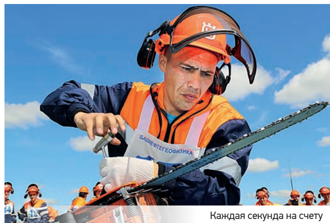
Каждая секунда на счету