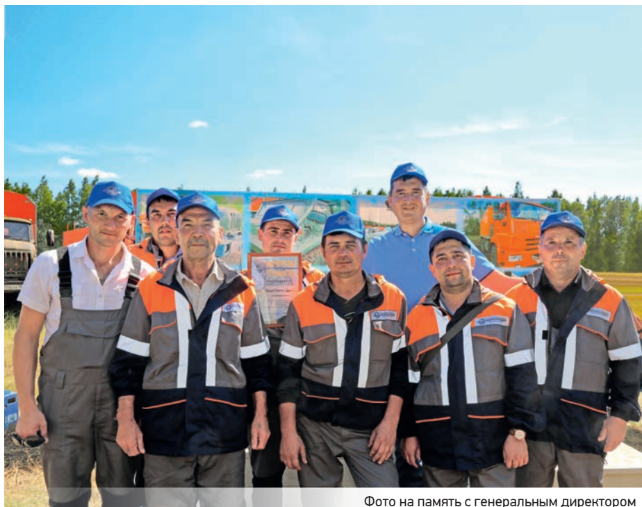
Фото на память с генеральным директором

Гульназира Ишбердина, «Российская газета»