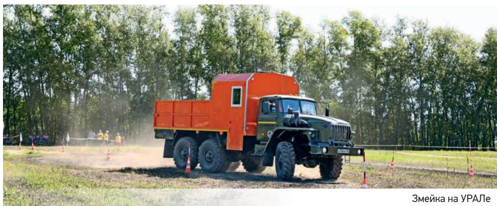
Змейка на УРАЛЕ

Всего в конкурсе участвовали 58 водителей: 42 на «КамАЗах» и «Уралах» и 16 – на вездеходах. Накануне они сдали экзамены на знание правил дорожного движения. Нужно было на время ответить на 20 вопросов. Здесь мастера вождения показали высокую квалификацию: большая часть сдала теорию без единой ошибки.