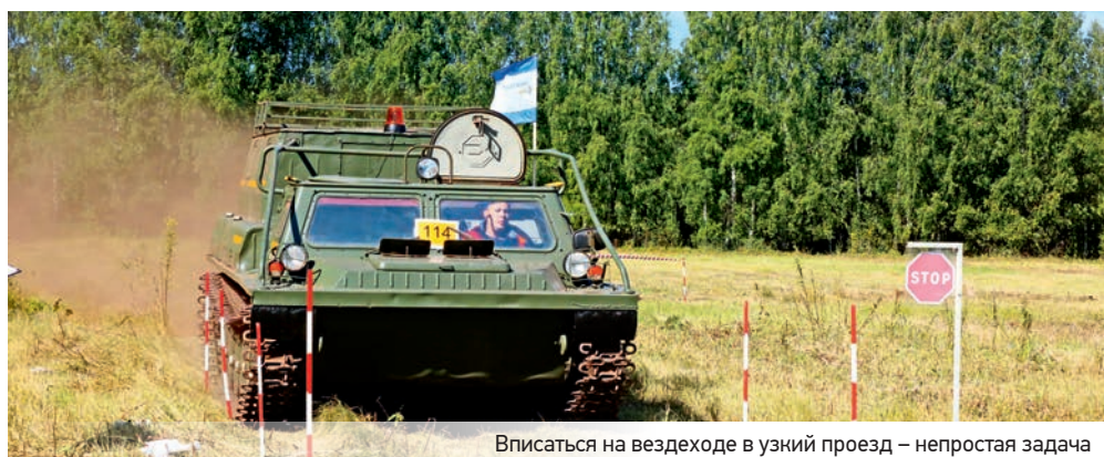
Вписаться на вездеходе в узкий проезд – непростая задача

В компании конкурсы лучших по профессии по разным рабочим специальностям проводятся постоянно. Только недавно завершились соревнования среди вальщиков леса и топографов. Теперь настал черед водителей – одного из самых многочисленных сообществ компании, которые управляют более чем 1600 единицами техники.