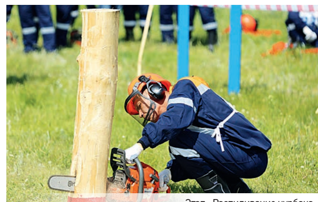
Этап «Распиливание чурбака»

фов напоминали увлекательный квест. Однако без знаний, опыта и профессионализма этих специалистов ни одна геофизическая партия не смогла бы выполнить свою задачу.