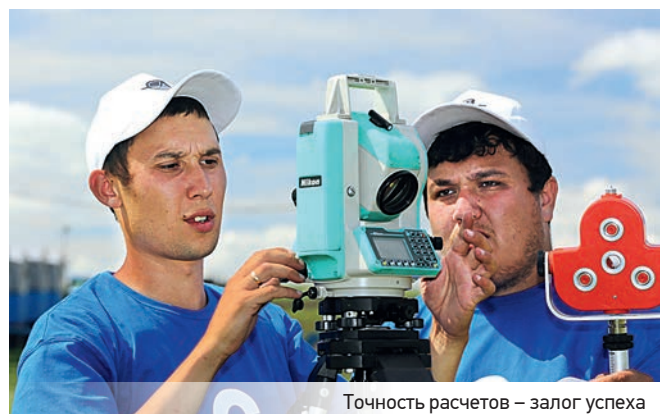
Точность расчетов – залог успеха

Профессиональные испытания начались с теоретической части. После успешного тестирования участники приступили к выполнению практических заданий.