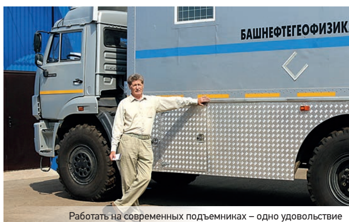
Работать на современных подъемниках – одно удовольствие