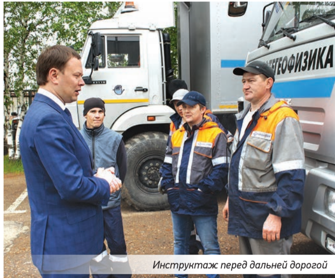
Инструктаж перед дальней дорогой

На территории производственной базы АО «Башнефтегеофизика» в Деме царит оживленная и вместе с тем рабочая атмосфера: комплектуются машины, приводится в порядок оборудование, водители проверяют работу двигателей и ходовую часть автомобиля. Впереди долгий – более 4000 километров – путь в Иркутскую область, на Ярактинское нефтегазоконденсатное месторождение.