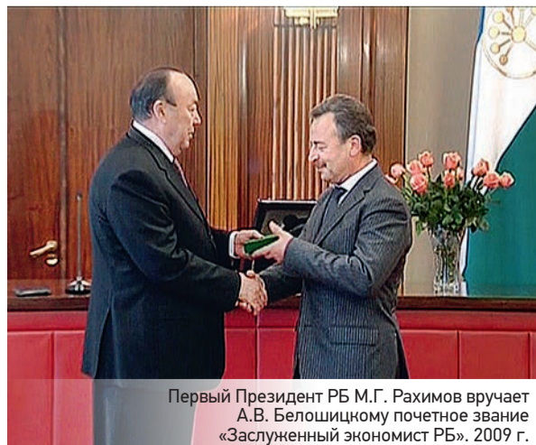
Первый Президент РБ М.Г. Рахимов вручает А.В. Белошицкому почетное звание «Заслуженный экономист РБ». 2009 г.