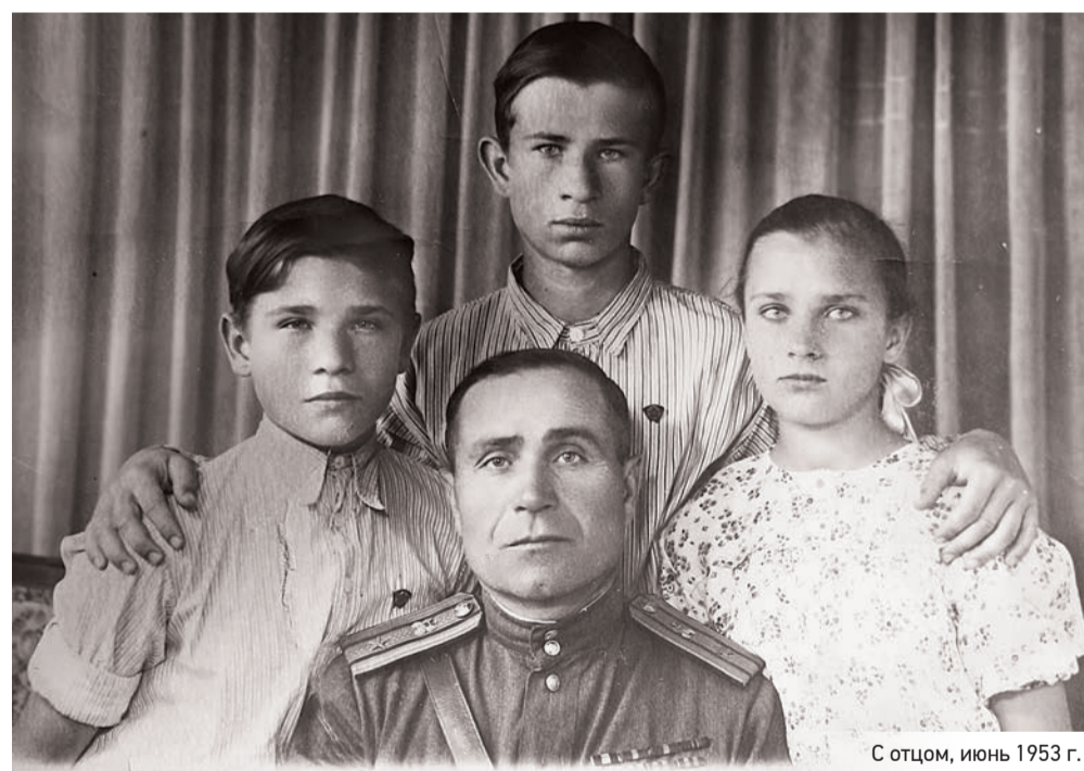
С отцом, июнь 1953 г.

комплексного развития скважинной сейсморазведки и практического утверждения ее как многофункционального поисково-разведочного метода в нефтяной отрасли нашей республики. В годы моей работы исследовательский арсенал пополнился целым рядом уникальных и высокоэффективных технологий анализа и геологической интерпретации данных скважинной сейсморазведки, обеспечивших ее стабильные успехи. Регулярно с коллегами мы проводили анализ геологической эффективности работ методами ВСП/НВСП. Активно занимался исследовательской деятельностью по этому на-