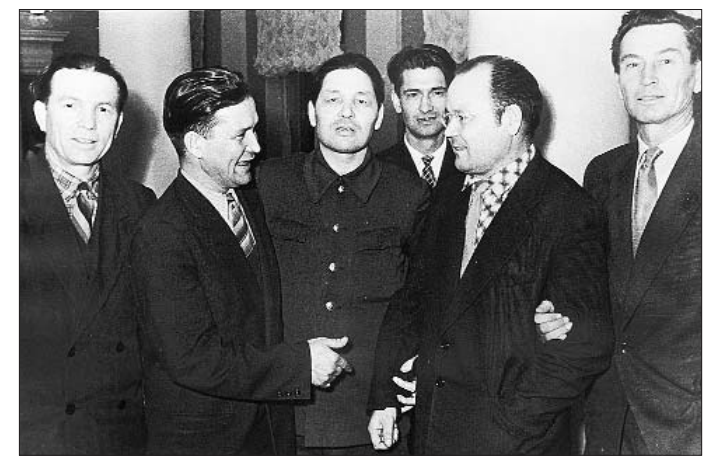
Писатель щедро делился опытом с коллегами и активно перенимал у них секретарской кухни.